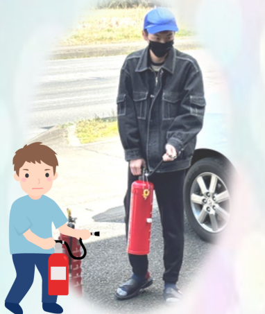
全集中！！水の呼吸！消火！

4月より、空の駅そらの直売所 & 物産館と茨城空港スカイアリーナにてシリウスのコーヒーを置いて頂けることになりました！ まだお試し段階ではありますが、近くにお立ち寄りの際にはぜひご覧ください♪