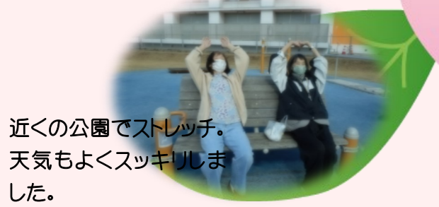
近くの公園でストレッチ。 天気もよくスッキリしました。

2/1より生活介護が始まりました。 始めに、身だしなみチェックを行い、午前中はカラオケ・ 脳トレ・読書等、午後は毎日体操を行っております。