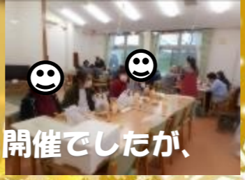
お天気に恵まれず、室内のみでの開催でしたが、 楽しむ事が出来ました！